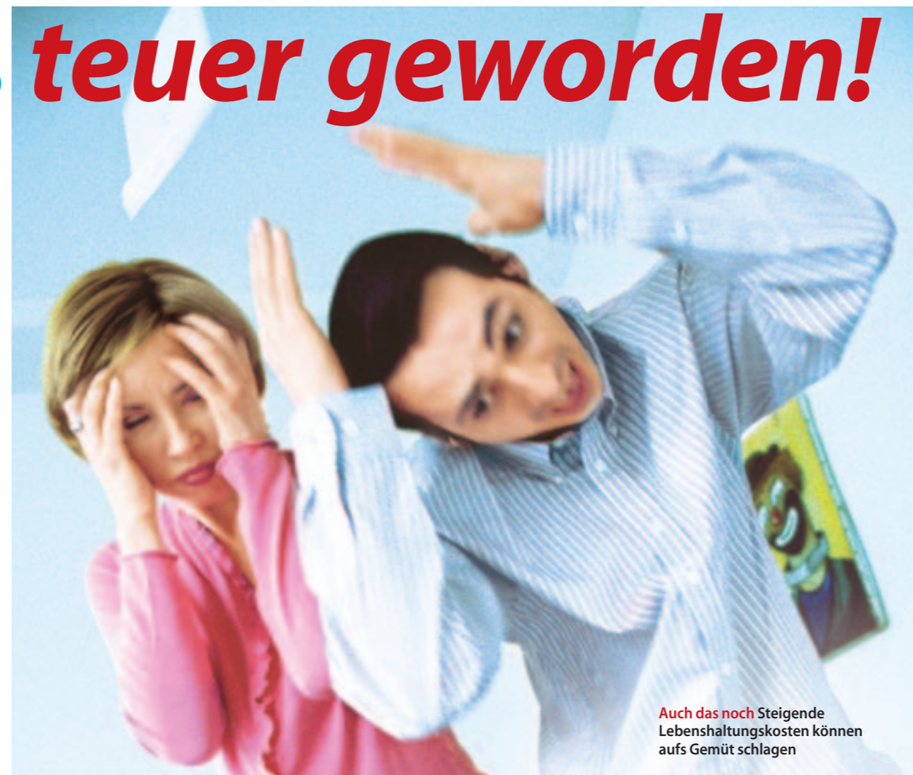
Auch das noch Steigende Lebenshaltungskosten können aufs Gemüt schlagen

TV-TIPP WISO Wirtschaftsmagazin MO · 3.12. · 19.25 Uhr · ZDF